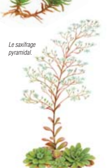
Le saxifrage pyramidal.