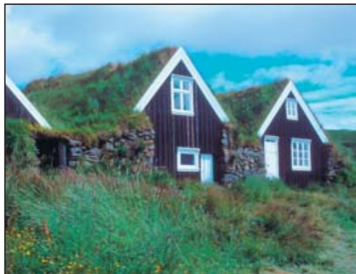
La ferme Sel, extérieur