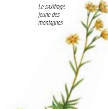
Le saxifrage jeune des montagnes

Le camping est spacieux. Il est permis à tout un chacun d'y planter sa tente ou d'installer sa caravane ou son camping-car moyennant une somme modique. Il est interdit de camper ou de passer la nuit dans des camping-cars ou caravanes en dehors des terrains de camping indiqués, à moins d'avoir obtenu une permission spéciale du Conservateur. Il n'y aucune route carrossable dans le parc national, à part celles qui conduisent aux fermes. Les parcs de stationnement sont près du camping d'où partent des sentiers de randonnée à travers tout le parc. Il faut rester sur les sentiers balisés.