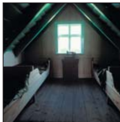
La ferme Sel, intérieur.

Skaftafell était naguère une ferme importante ainsi qu'un lieu de rassemblement. Très tôt elle devint propriété de l'église et ensuite du roi. Les bâtiments étaient naguère au pied des collines et on en voit encore les ruines près d'Eystragil, dans un site appelé Gömlutún. Les crues de la Skeiðará ont couvert peu à peu les anciens près de sable et la ferme a été déplacée de 100 mètres sur le versant de la colline, dans les années 1830 à 1850.